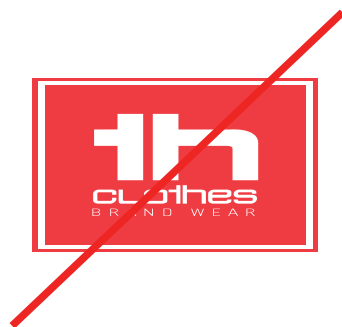
Deformar el logotipo