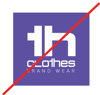
Fundos não institucionais