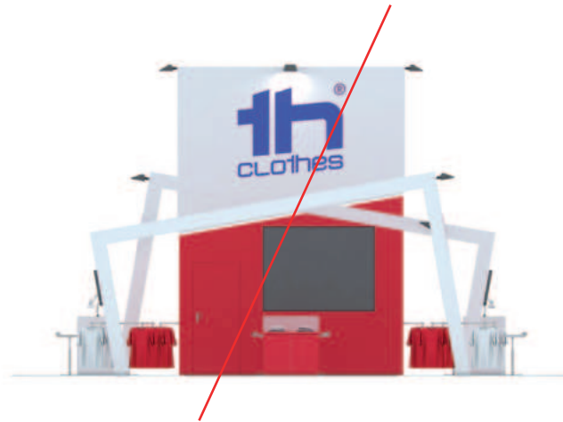
Cambiar los colores del logotipo