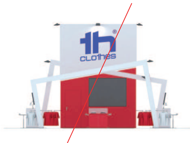
Alterar cores de logótipo